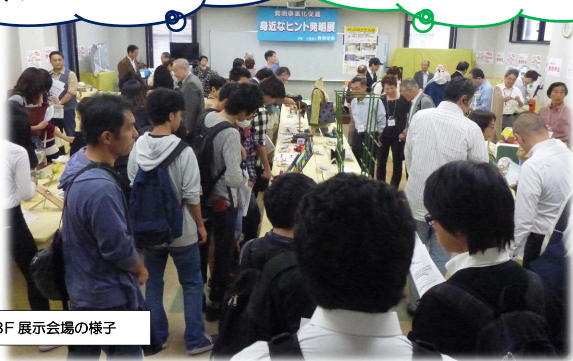
昨年の3F 展示会場の様子

発明家だけでなく、マスコミ、協賛会 社の社長さん、学生などたくさんの方 が来訪するため、販売には最適です！